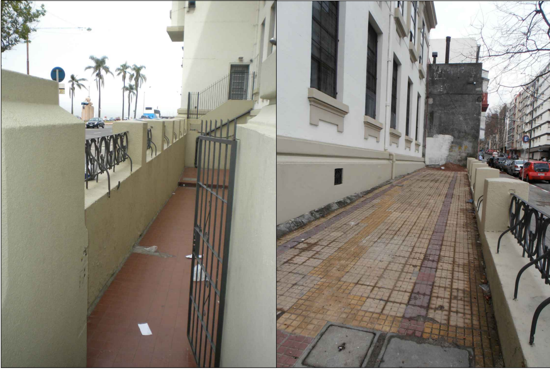
FOTO 06: RETIRO TOTAL DE PAVIMENTO EXISTENTE EN ZONA DE SUBSUELO FOTO 07: RETIRO PARCIAL DE BALDOSAS DE 9 PANES PARA CANALIZACIONES DE PLUVIALES. VER SANITARIA

FOTO 01: CERCHAS EXISTENTES EN CUBIERTA A MANTENER. SE MODIFICARÁN SEGÚN PLANOS DE ESTRUCTURA. FOTO 02: RETIRAR EMBUDOS EXISTENTES. FOTOS 03,04,05: RETIRAR COMPLETAMENTE SOBRETecho DE CHAPA, CANALÓN METÁLICO EXISTENTE Y BABETAS. RETIRAR MEMBRANA ASFÁLTICA QUE CUBRE BABETAS, CANALONES Y TODA LA CABEZA DE LOS MUROS PRETIL.