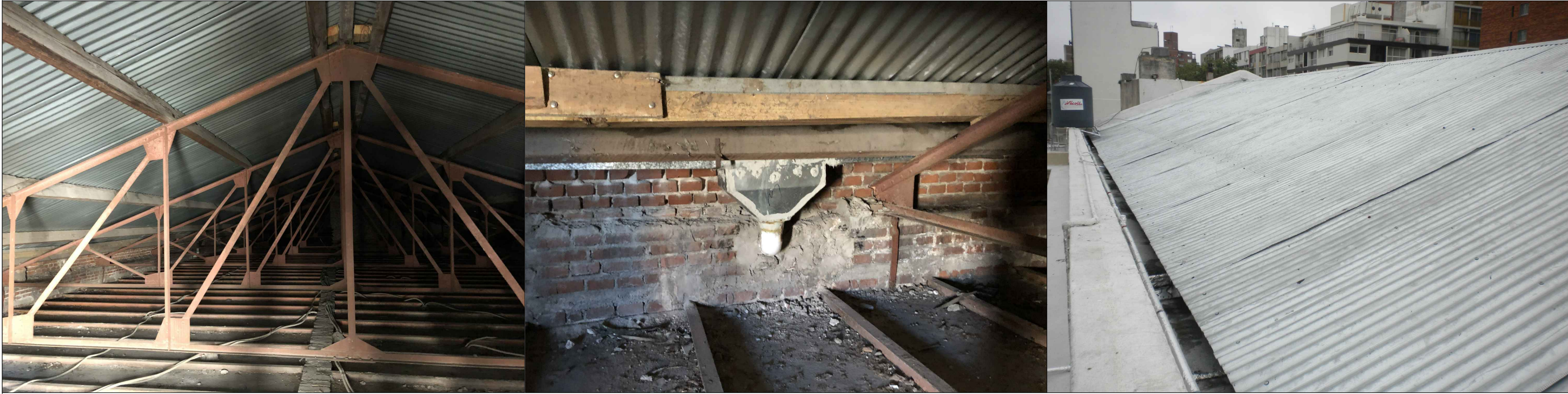
FOTO 01: CERCHAS EXISTENTES EN CUBIERTA A MANTENER. SE MODIFICARÁN SEGÚN PLANOS DE ESTRUCTURA. FOTO 02: RETIRAR EMBUDOS EXISTENTES. FOTOS 03,04,05: RETIRAR COMPLETAMENTE SOBRETecho DE CHAPA, CANALÓN METÁLICO EXISTENTE Y BABETAS. RETIRAR MEMBRANA ASFÁLTICA QUE CUBRE BABETAS, CANALONES Y TODA LA CABEZA DE LOS MUROS PRETIL.

FOTO 06: RETIRO TOTAL DE PAVIMENTO EXISTENTE EN ZONA DE SUBSUELO FOTO 07: RETIRO PARCIAL DE BALDOSAS DE 9 PANES PARA CANALIZACIONES DE PLUVIALES. VER SANITARIA